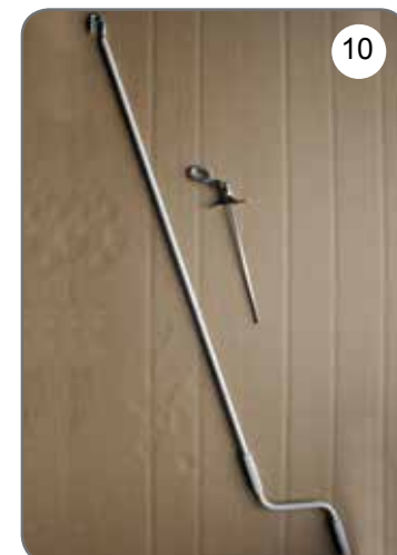
Korba, przegub Cardana 45° lub 90° z uchem [10].