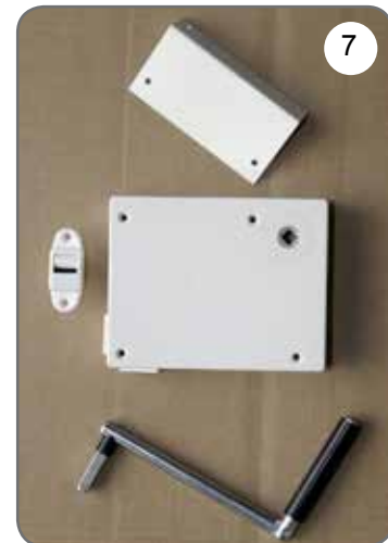
Kaseta z przekładnią na taśmę (pasek), płytka do mocowania kasety, prowadnica taśmy (paska), korba [7].